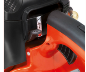
Touch&Stop Einhebelbedienung mit klaren Stellungen, Motor geht durch leichtes Antippen des Hebels aus