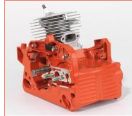
Solider Motorblock aus Magnesium-Druckguss