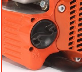
Gut zugängliche Öl- und Tankdeckel